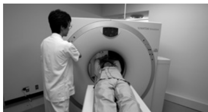
▲全身用CTスキャン装置