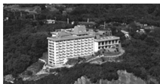
▲下田ビューホテル