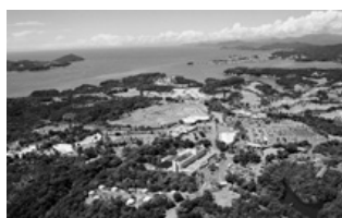
▲NEMU RESORT HOTEL NEMU