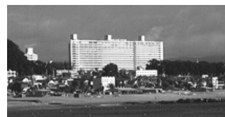
▲マホロバ・マイنز三浦