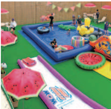
スプラッシュパーク(夏季限定)