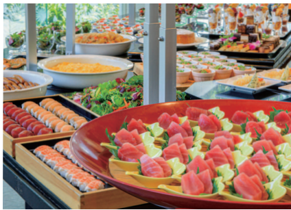
夕食バイキング(イメージ)