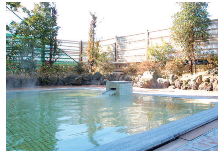
三浦エリア随一の天然温泉