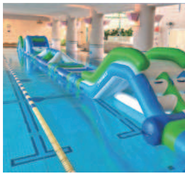
25m温水プール(※ウォーターアスレチック)