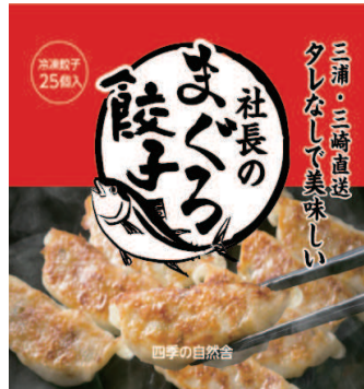
当ホテルオリジナル「社長のみぐろ餃子」

※外部で購入された飲食物の持ち込みはご遠慮いただいております。売店で購入されたものは客室へ持ち込みいただけます。