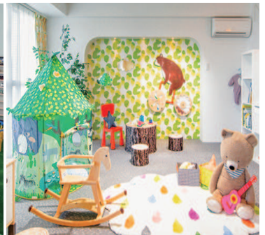
3世代ベビールーム