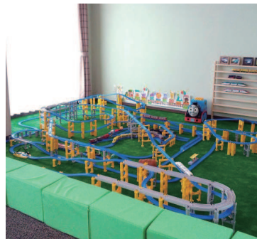
電車で遊ぶファミリールーム